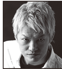
K O B A