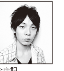
森康記 (株)ミュージックバンカー