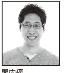
間内優 (株)ミュージックバンカー